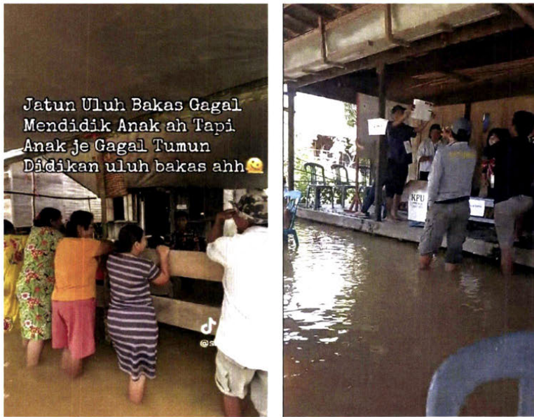
Kondisi Banjir di Tempat Pemungutan Suara (TPS), Kecamatan Pasak Talawang [Bukti P-28] dan [Bukti P-29]

26. Bahwa Termohon telah mengurangi partisipasi pemilih—yang tidak menutup kemungkinan akan memilih Pemohon—dengan tidak menunda pelaksanaan pemungutan suara di sejumlah kecamatan akibat bencana banjir. Berdasarkan laporan Plt. Kepala Badan Penanggulangan Bencana (BPBD) Kapuas, Saribi yang dilansir Kompas.com, banjir telah merendam 4 (empat) kecamatan sejak tanggal 26 November 2024 (H-1 pemungutan suara) [Bukti P-27]. Banjir tersebut menggenangi di Kecamatan Pasak Talawang, Kecamatan Timpah, Kecamatan Kapuas Tengah, dan Kecamatan Mantangai.