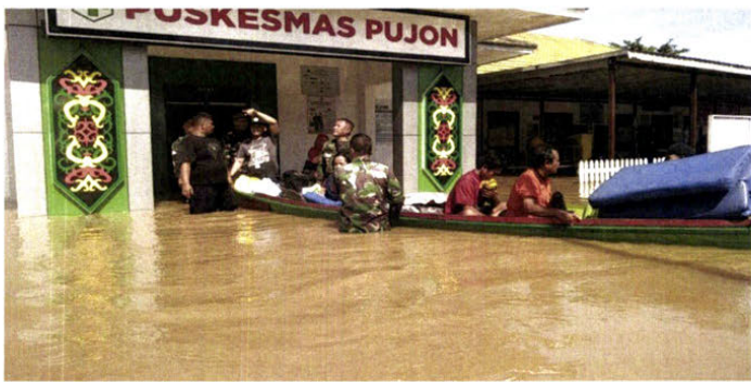
Kondisi Banjir di Kecamatan Kapuas Tengah [Bukti P-30]