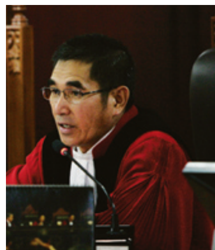
Wakil Ketua MK Hamdan Zoelva

Hamdan berpandangan, hukum ketenagakerjaan tidak saja melindungi