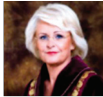
Vineta Muižniece Justice of the Constitutional Court

Keputusan MK mengikat semua lembaga negara dan kota, kantor dan pejabat, termasuk lapangan serta perorangan dan hukum.