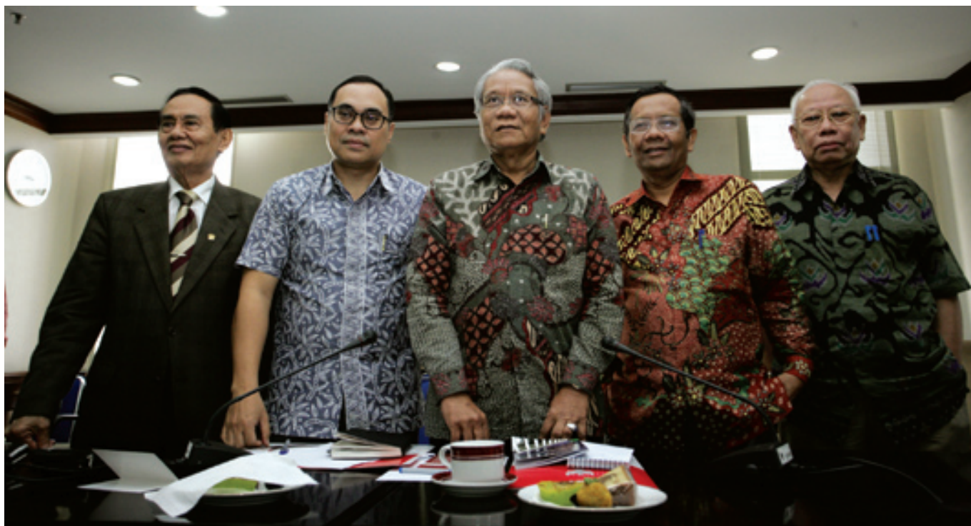
Anggota Majelis Kehormatan Mahkamah Konstitusi