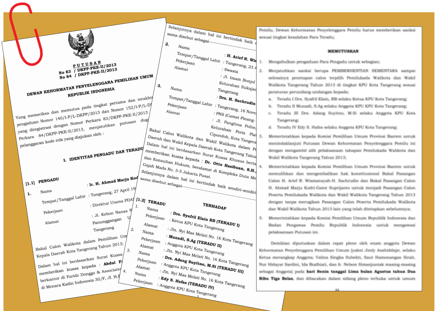
Putusan DKPP Nomor 83/DKPP-PKE-II/2013 dan Nomor 84/DKPP-PKE-II/2013