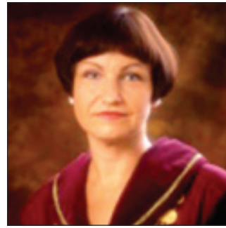
Sanita Osipova Justice of the Constitutional Court