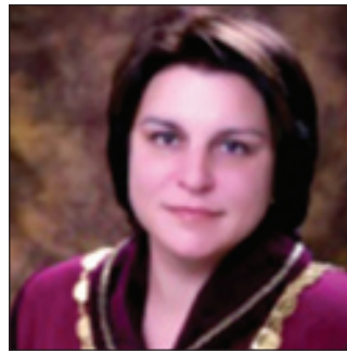
Kristīne Krūma Justice of the Constitutional Court