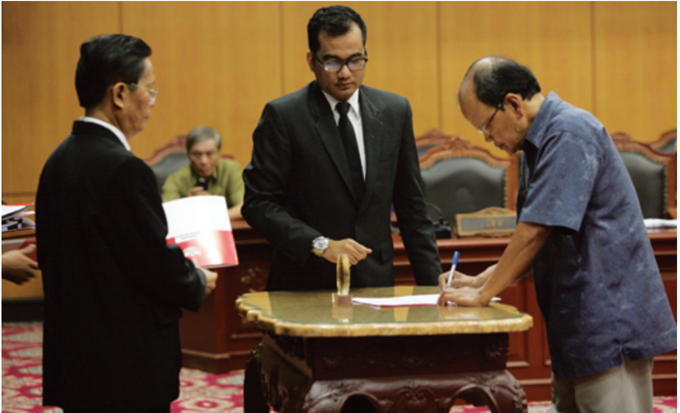
Pemohon Prinsipal Duta Mardin Umar menandatangani berita acara penyerahan salinan putusan uji materi UU Pemilu Legislatif, Kamis (19/7/2013) di Ruang Sidang Pleno Gedung MK.