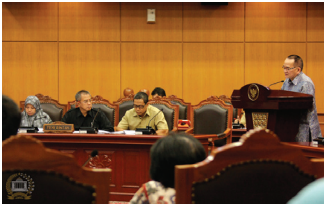
Anggota Komisi III DPR Ruhut Sitompul (podium), menyampaikan keterangan DPR dalam Sidang Pengujian UU Perkoperasian di Ruang Sidang Pleno Gedung MK, Senin (9/9/2013).