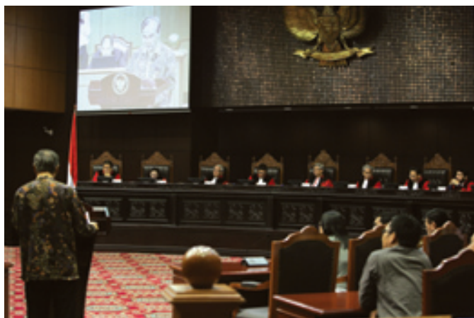
Suasana sidang pengujian UU PDRD dengan agenda mendengar keterangan ahli, Kamis (12/9/2013) di Ruang Sidang Pleno Gedung MK.