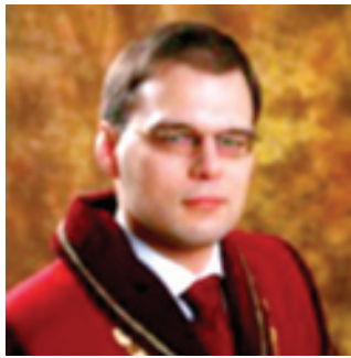
Kaspars Balodis Justice of the Constitutional Court