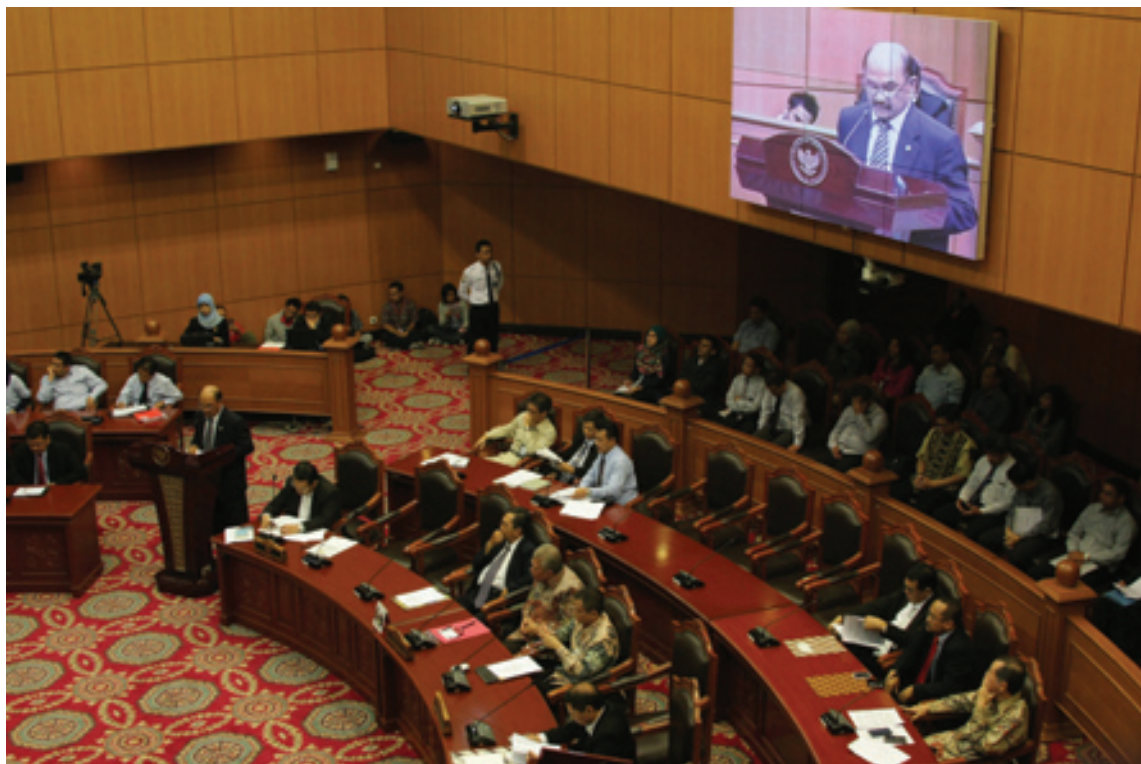
Wakil Ketua Badan Pemeriksa Keuangan (BPK) Hasan Bisri saat memberikan tanggapan dalam sidang pengujian UU Keuangan Negara di Ruang Sidang Pleno Gedung MK, Rabu (4/9/2013).

Undang-Undang Keuangan negara selaras dengan prinsip akuntabilitas dan transparansi pengelolaan keuangan Negara. Prinsipnya, penggunaan keuangan negara sekecil apa pun wajib dipertanggungjawabkan oleh penggunaannya atau oleh siapa pun yang mendapat dana, fasilitas yang bersumber dari keuangan Negara. DPR berpandangan, diperlukan kehati-hatian dalam memahami konteks kedudukan keuangan negara sebagai kekayaan yang dipisahkan dalam Badan Usaha Milik Negara (BUMN), Badan Usaha Milik Daerah (BUMD) atau badan hukum yang menggunakan fasilitas pemerintah. “Diperlukan kehati-hatian dengan tujuan untuk menjaga kekayaan negara tidak hilang begitu saja tanpa bisa dipertanggungjawabkan atau pun negara menanggung beban kewajiban terlalu jauh,” kata Wakil Ketua Komisi III DPR RI Al Muzammil Yusuf dalam persidangan di MK, Rabu (4/9/2013). Sidang kali keempat untuk gabungan Perkara Nomor 48/PUU-XI/2013 dan 62/PUU-XI/2013