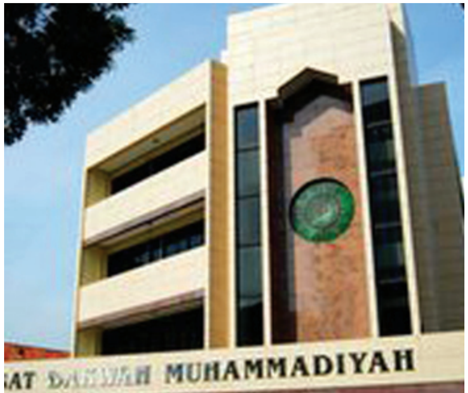
Gedung PP Muhammadiyah Jakarta

Pemberdayaan terhadap Ormas yang dilakukan oleh pemerintah dan/ atau pemerintah daerah, sebagaimana ketentuan Pasal 40 UU Ormas, merupakan