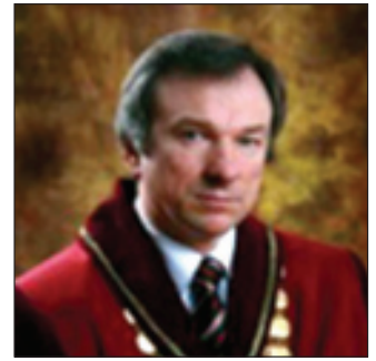
Uldis Ķinišs Justice of the Constitutional Court