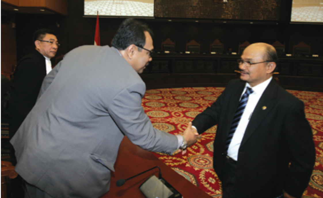
Wakil Ketua Badan Pemeriksa Keuangan (BPK) Hasan Bisri menyalami pemohon prinsipal Bahrullah Akbar usai sidang putusan pengujian UU BPK di Ruang Sidang Pleno Gedung MK, Selasa (10/9/2013).