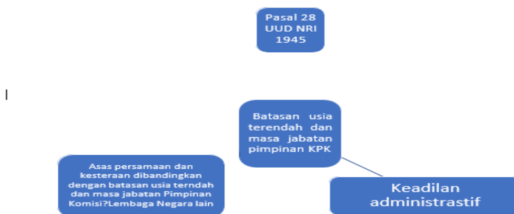
Gambar 2 Mind Mapping Pengaturan Batasan Usia Terendah dan Masa Jabatan Pimpinan Komisi/Lembaga Negara

Pengaturan mengenai syarat usia bagi pimpinan Komisi/Lembaga Negara dan masa jabatannya berada di ranah norma hukum administrasi negara sektoral. Fransisco Esparaga dan Ian Ellis-Jones (2011:1) mengingatkan bahwa Hukum Administrasi Negara harus mampu mewujudkan keadilan administratif ( administrative justice ) yang unsur-unsur pokoknya ( core elements ) meliputi: keabsahan ( lawfulness ), keadilan ( fairness ) dan rasionalitas ( rationality ) dalam penggunaan kekuasaan publik. Baik jika pengaturan mengenai syarat batasan usia terendah dan tertinggi bagi KPK RI mengandung unsur-unsur pokok keadilan administratif tersebut sehingga menghindari terjadinya diskriminasi pengaturan.