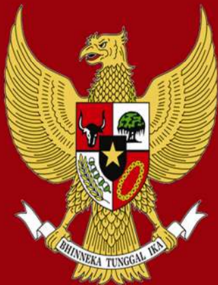
MAHKAMAH KONSTITUSI REPUBLIK INDONESIA