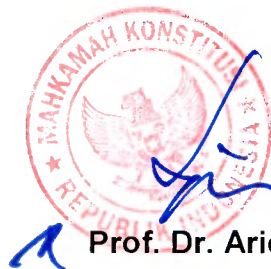
Prof. Dr. Arief Hidayat, S.H., M.S.

MENGETAHUI, KETUA MAHKAMAH KONSTITUSI REPUBLIK INDONESIA,