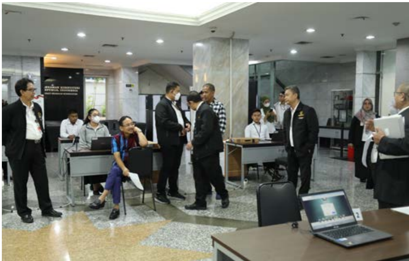
KETUA MK SUHARTOYO DALAM KEGIATAN SIMULASI PENANGANAN PPHU 2024.