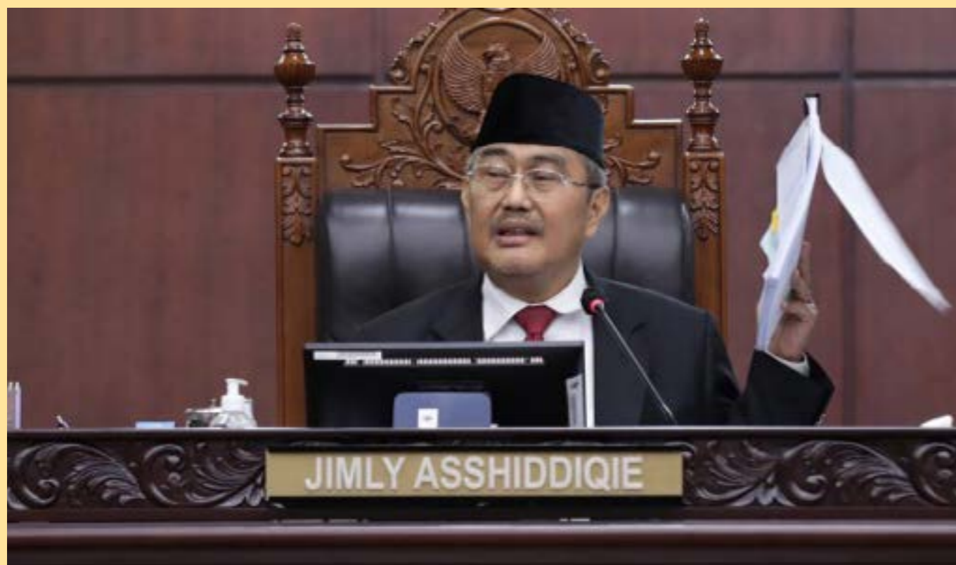
KETUA MKMK AD HOC JIMLY ASSHIDDIQIE.

Berdasarkan Putusan MKMK Nomor 2/MKMK/L/11/2023, MK diharuskan melakukan pemilihan ketua baru. Hal ini berdampak pada peralihan Ketua MK dari Anwar Usman kepada Suhartoyo.