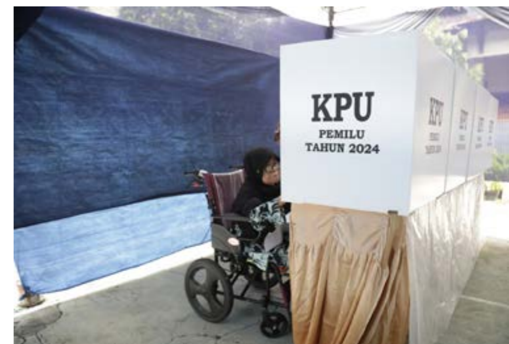
PROSES PENCOBLOSAN DALAM PEMILU TAHUN 2024 PADA RABU (14/2) SILAM.

Hasil Pemilu 2009 juga tak lepas dari sengketa. Untuk kali yang kedua sejak Pemilu 2004, pada Pemilu 2009 MK menangani sengketa hasil Pemilu. Sebanyak 69 perkara perselisihan hasil Pemilu Legislatif 2009 diputus MK. MK juga memutus perkara perselisihan hasil Pemilu Presiden dan Wakil Presiden yang diajukan oleh pasangan Megawati Soekarnoputri-Prabowo Subianto, dan pasangan Muhammad Jusuf Kalla-Wiranto.