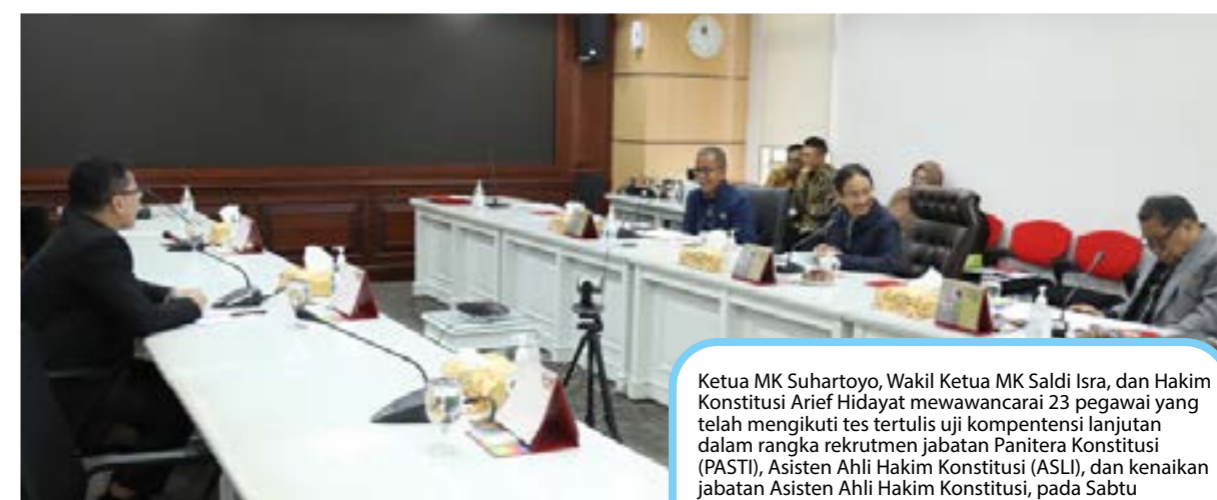
Ketua MK Suhartoyo, Wakil Ketua MK Saldi Isra, dan Hakim Konstitusi Arief Hidayat mewawancarai 23 pegawai yang telah mengikuti tes tertulis uji kompetensi lanjutan dalam rangka rekrutmen jabatan Panitera Konstitusi (PASTI), Asisten Ahli Hakim Konstitusi (ASLI), dan kenaikan jabatan Asisten Ahli Hakim Konstitusi, pada Sabtu (3/2/2024) di Gedung 1 MK.