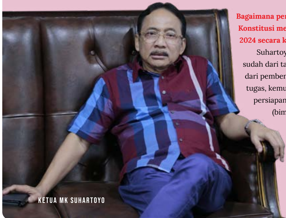
KETUA MK SUHARTOYO

Berikut wawancara tim redaksi Majalah Konstitusi bersama Ketua MK Suhartoyo mengenai kesiapan MK menangani PHPU Tahun 2024.