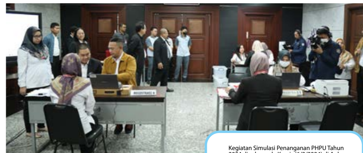
Kegiatan Simulasi Penanganan PHPU Tahun 2024 digelar pada Kamis (6/2/2024) di Aula Gedung 1 MK, Jakarta.