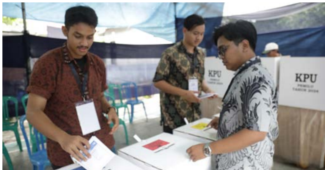
SUASANA PEMILU TAHUN 2024 PADA RABU (14/2) SILAM.